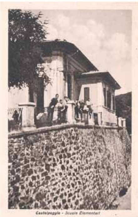
Castelpoggio - Scuole Elementari