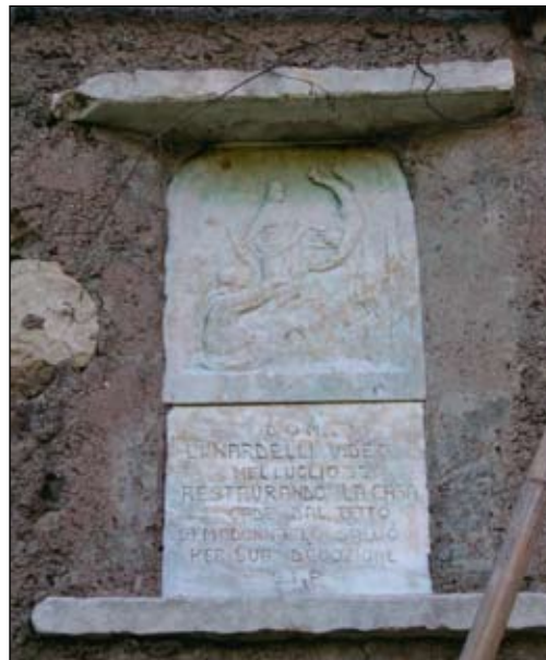
11. Madonna 1933 25 x 30 cm Ca' di Marion