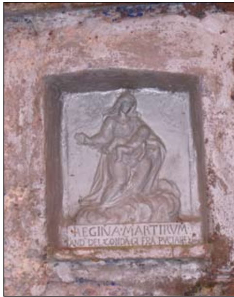
8. Madonna "Regina dei Martiri" 1780 28 x 21 cm Via Vasco Venturoli 34 (colle)