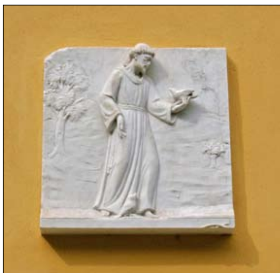
25. San Francesco - 2006 Via Emilia