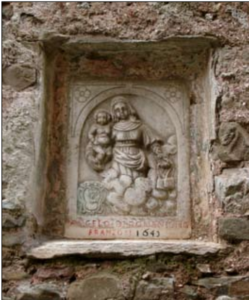
4. Madonna del Carmine 1643 41 x 31 cm Via Trento 3