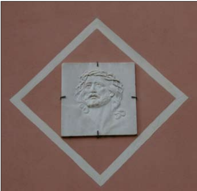
15. Christo coronato di spine Senza date 33 x 31 cm Via del Fosso 3