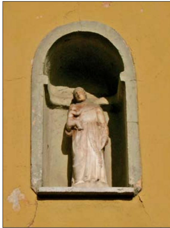
14. S. Antonio da Padova Senza date 46 x 15 cm Piazza Primo Ricci 13 (Dogana)