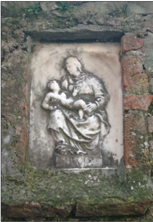
13. Madonna con Bambino Senza date 55 x 35 cm Via Vasco Venturrelli 20 (alla torre)