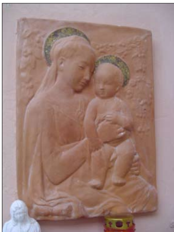
23. Madonna con Bambino in terracotta di Giromini Alberto - 1999 Via Vasco Venturelli n.7