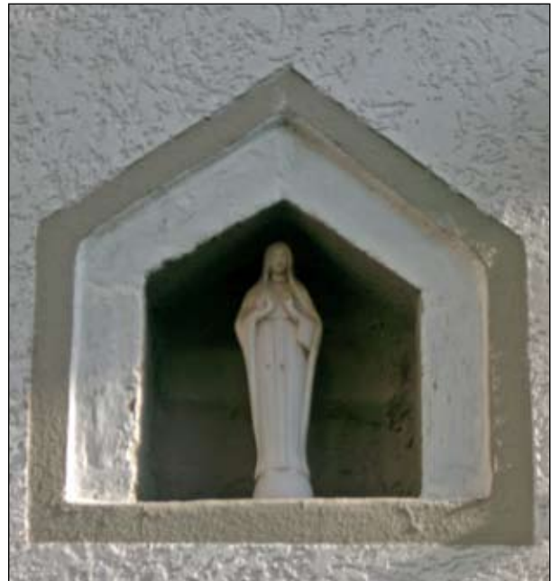
16. Madonna Senza date statiuna moderna Via Vasco Venturrelli 17 (alla torre)