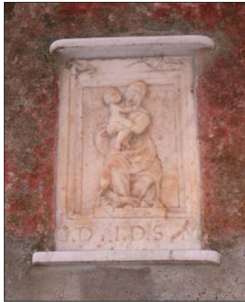
2. Madonna col Bambino 1626 35 x 20 cm Salita Florindo Bonomi 5 (castello)