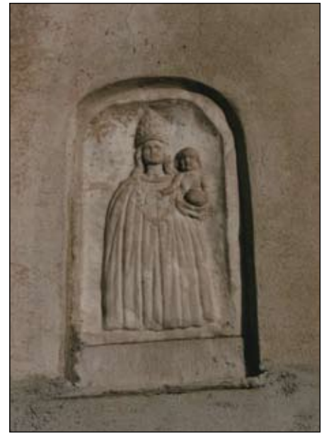
9. Madonna di Loreto 1799 50 x 33 cm Salita Casa Nuova 12