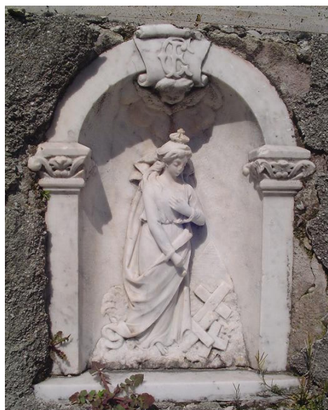
26. Madonna Via della Tecchia