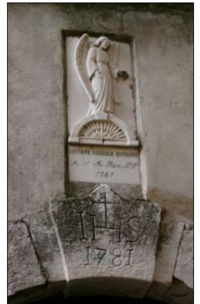
12. Angelo Custodo 1981 54 x 21 cm Via Trento 2 (Miaterra)