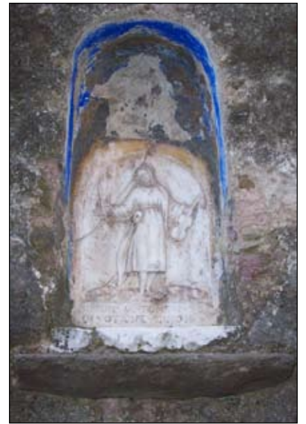
3. San Ginesio 1641 30 x 29 cm Via Vasco Venturrelli 20