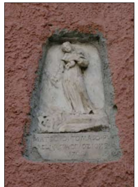
6. S. Antonio da Padova 1709 40 x 25 cm Via Vasco Venturrelli 18 (alla torre)