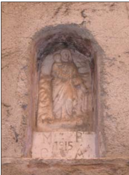
10. Madonna del Rosario 1915 35 x 16 cm Salita Casa Nuova 1