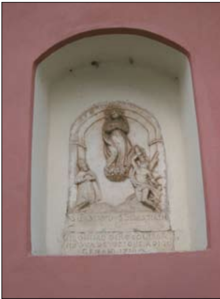
7. Madonna e SS. Fabiano e Sebastiano 1716 61 x 41 cm Piazza Primo Ricci 5 (dogana)