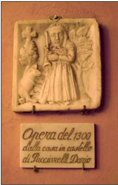
1. S. Antonio Abate XIII secolo 27 x 26 cm Era posta in località castello, dopo la demolizione della casa fu donata alla chiesa