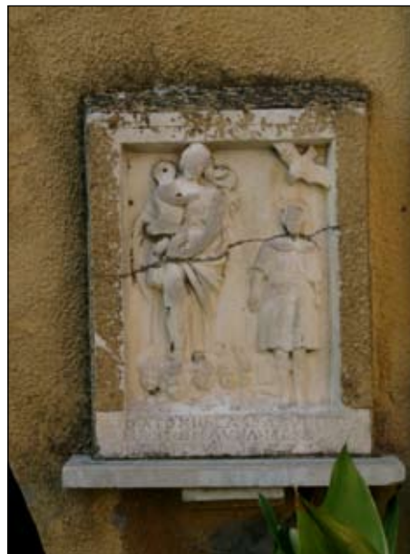
5. Madonna e S. Ginesio 1677 52 x 42 cm Chiasso Bastione