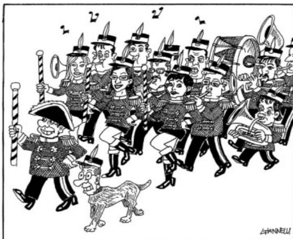
LA BANDA LARGA

Riassumendo: vorremmo essere smentiti dai fatti, ma l'unica banda che potremo aspettarci a breve sarà questa: